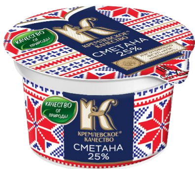
Сметана 25% 250гр