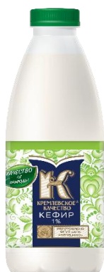
Кефир 1% 930мл