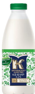
Кефир 3,2% 930мл