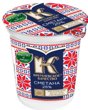
Сметана 25% 500гр