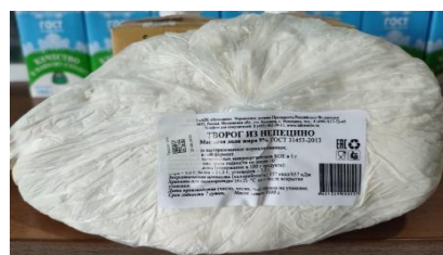
Творог 9% 1кг