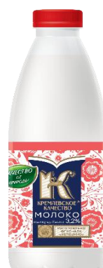
Молоко 3,2% 930мл